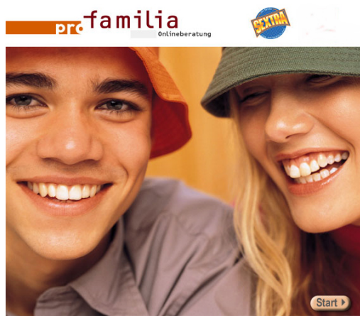
Interner Online - Beraterzugang "Automail"

Zur Zeit haben wir 80 Beraterinnen und Berater, die Zugang auf unseren Server haben, wo sie die unbeantworteten Anfragen je Beratungsschwerpunkt bearbeiten können.