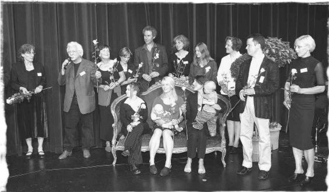
Vorstand und pro familia-Team Tübingen / Reutlingen